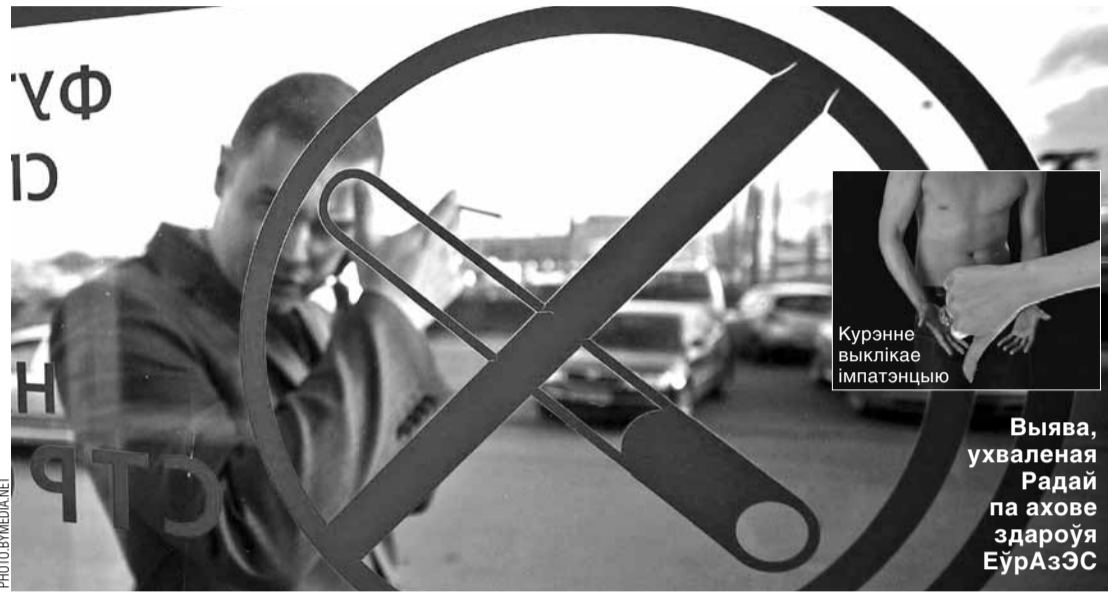
Курэнне выклікае імпатэнцыю

Выява, ухваленая Радай па ахове здароўя ЕўрАзЭС