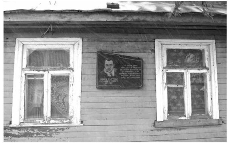
Родная хата Жылуновіча ў Капылі захавалася дагэтуль. Яна прыватызаваная, але выглядае нежылой.

І не запратастуетш, і не назавеш ашуканцамі. У большавікоў жалезная субардынацыя і дысцыпліна. Арганізацыя, якая ад самага пачатку мела адзнакі крымінальнай групы.