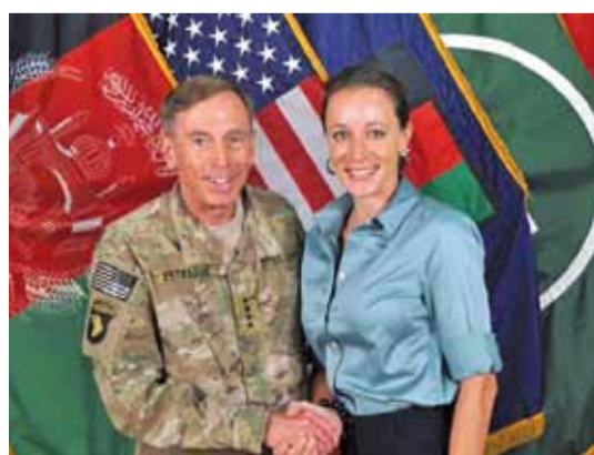
Пэтрэус разам з каханкай.

Нечаканая навіна з Амерыкі: знакаміты генерал Дэвід Пэтрэус павініўся.