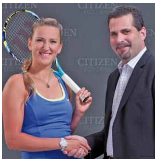
Першая ракетка свету, беларуская тэнісістка Вікторыя Азаранка стала тварам вядомай гадзіннікавай кампаніі Citizen.