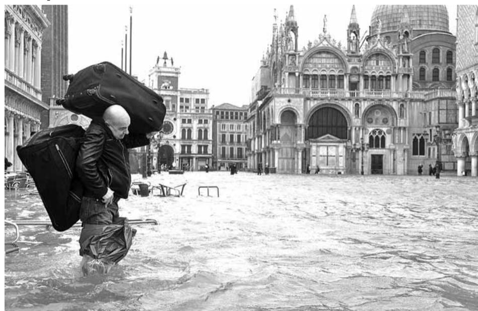
У выніку праліўных дажджоў тэрыторыя Венецыі на 70% сышла пад ваду.