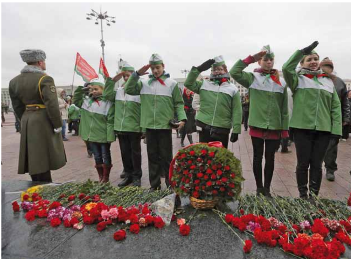
Школьнікаў і студэнтаў сагналі 7 лістапада да помніка Уладзіміру Леніну. Яны падыходзілі арганізаванымі групамі на чале з куратарамі. Праўда, не ўся моладзь ведала, што адзначаюць у гэты дзень.

*** Адзіным кандыдатам ад апазіцыі стане той, хто застанеца ў краіне. *** — Чаму ты вырашыў, што КДБ усталяваў у тваёй кватэры «жучок» для праслухоўвання? — У мяне ў пакоі з учарашняга дня стала адну шафу больш... *** Без панікі! Урадам праводзіцца тактычнае скарачэнне золатавалютных рэзерваў з мэтай аптымізацыі іх захоўвання — чым менш рэзерваў, тым менш іх страціш. *** Як добра было раней: бярэш газетку і ідзеш у прыбіральню. А цяпер — нібы ў экспедыцыю збіраешся: ноўтбук, iPad, два мабільнікі... *** Як завязаць марскі вузел? 1. Згортваеш акуратненька навушнікі. 2. Кладзеш у кішэню. 3. Дастаеш — марскі вузел гатовы! *** За рулём адчуваю сябе багіняй ... Я еду, а муж моліцца! *** Жанчына прыходзіць на працу з фінгаламі пад вокам. Супрацоўнік заўважыў, пытаецца: — Хто гэта цябе так? — Муж! — Муж? Я думаў ён у камандзіроўцы ... — Ха! Ён думаў... Я была ў гэтым упэўненая!