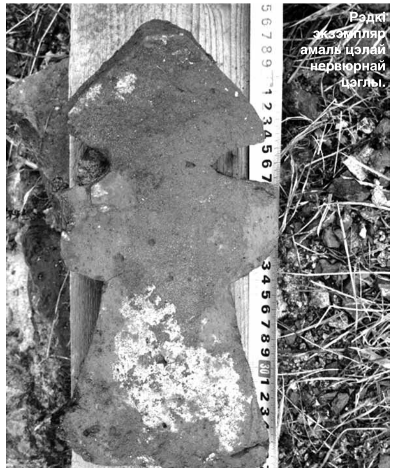
Рэдкі экзэмпляр амаль цэлай нервюрнай цэглы.

Нам яшчэ трэба навучыцца аднаўляць па абломках старажытных мастацкія вобразы ды ўзнаўляць іх пры рэканструкцыі нашых помнікаў.