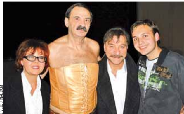
Ілля Алейнікаў (другі злева) з Аляксандрам Ціхановічам і Ядвігай Паплаўскай падчас мінскай рэпетыцыі «Прарока».