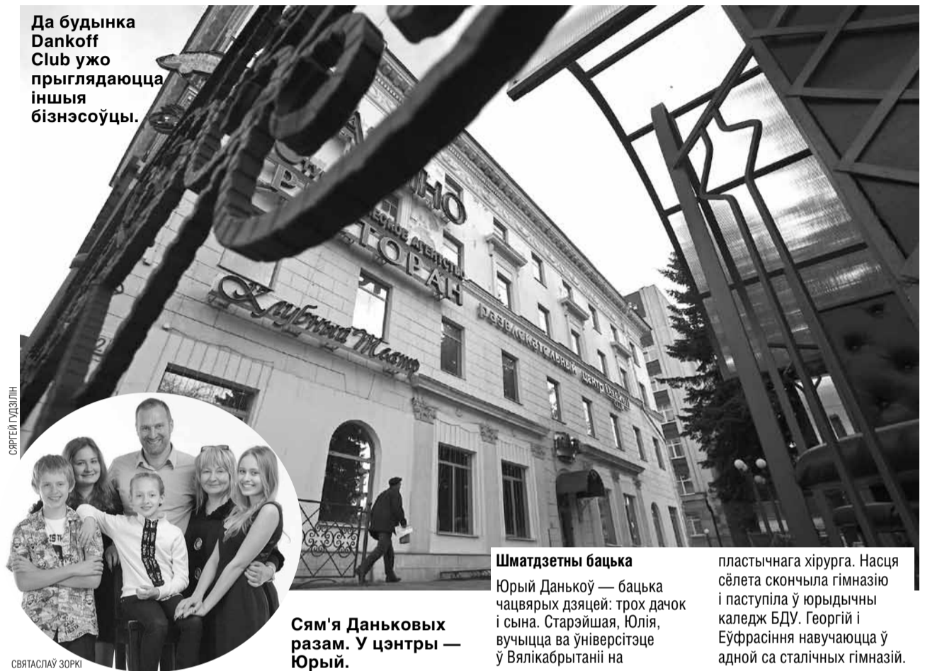
Да будынка Dankoff Club ужо прыглядаюцца іншыя бізнэсоўцы.