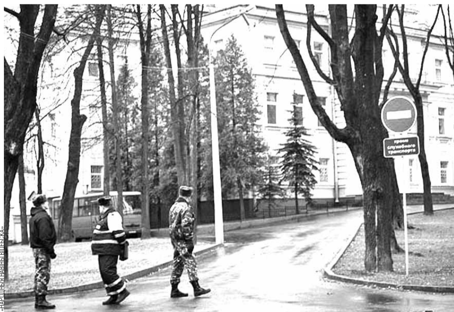
У панядзелак будынак віцебскага КДБ быў ачэплены, блізка да яго нікога не падпускілі.

На беларуска-польскай мяжы адбыўся выбух