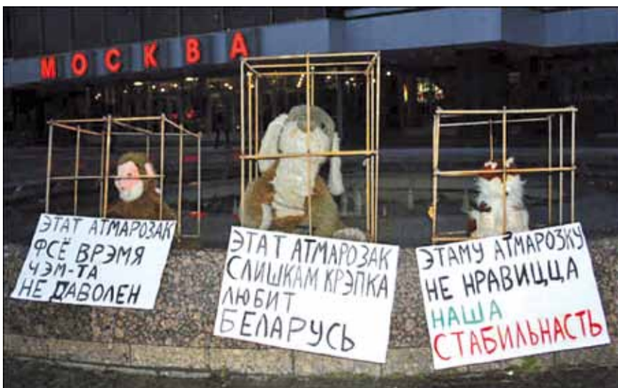
8 лістапада моладзевыя актывісты кампаніі «Гавары праўду» — «Змена» — правялі перформанс каля кінатэатра «Масква» на праспекце Пераможцаў. За кратамі апынуліся толькі плюшавыя цацкі.