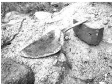
Кельма будаўніка Крэўскага замка.

Археалагі вывучаюць Крэўскі замак чатыры дзесяцігоддзі. У 1970—1980-я такія даследчыкі, як Міхась Ткачоў, Алег Трусаў, Ігар Чарняўскі займаліся вывучэннем гэтай найстарэйшай кастэлі Вялікага Княства Літоўскага. Новы этап археалагічных прац звяза-