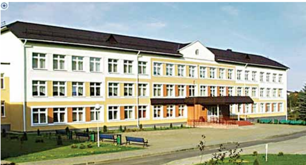
Так выглядае звычайная вясковая школа ў Асташыцкім Гарадку.