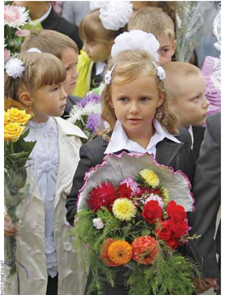
Першы званок. 88 тысяч малых 1 верасня ўпершыню селі за школьныя парты. Працэнт дзяцей, што навучаюцца па-беларуску, зніжаецца штогод. Сёлета такіх будзе менш за 18%.