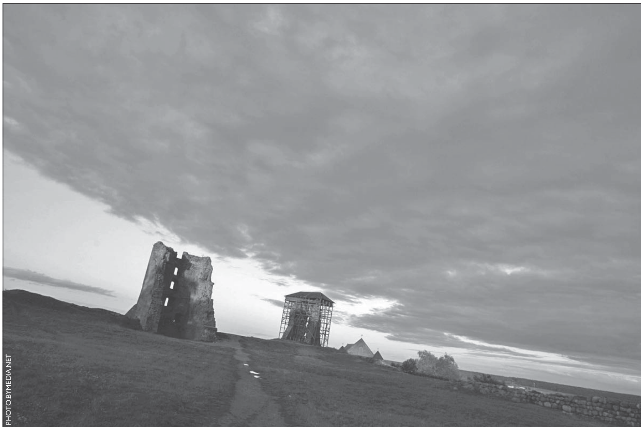
Наваградак — першая сталіца Вялікага княства Літоўскага.

беларусы не вызваліліся б ад татарскага прыгнёту. Хаця ніколі беларусы пад ім не былі. Тое, што нашыя землі пазьбеглі мангольскае навалы — адна з найважнейшых адметнасцяў нашае гісторыі. Татарскае ярмо было трагедыяй для расейскіх земляў, якія страцілі праз гэта шанцы на прыналежнасць да эўрапейскае культуры.