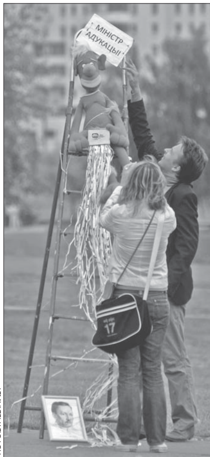
Менская моладзь пратэстуе супраць выкіданьня клясыкі з падручнікаў.

Я далёкі ад таго, каб пераацэньваць у сёньняшняй Беларусі — зь сёньняшнімі настаўнікамі і зь сёньняшняй дзяржаўнай адукацыйнай палітыкай — ролі беларускай літаратуры як гуманітарнай дысцыпліны. Але, далібог, наша літаратура не заслугоўвае таго, каб і надалей ад яе імя імкнуліся прамаўляць графаманы й проста хворыя людзі.