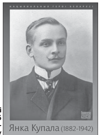
Янка Купала (1882-1942)

Выйшаў першы плякат з сэрыі «Нацыянальныя героі Беларусі». Каб набыць, пытайцеся праз тэл. (029) 505- 39-11 або праз e-mail: plakat@biz.by