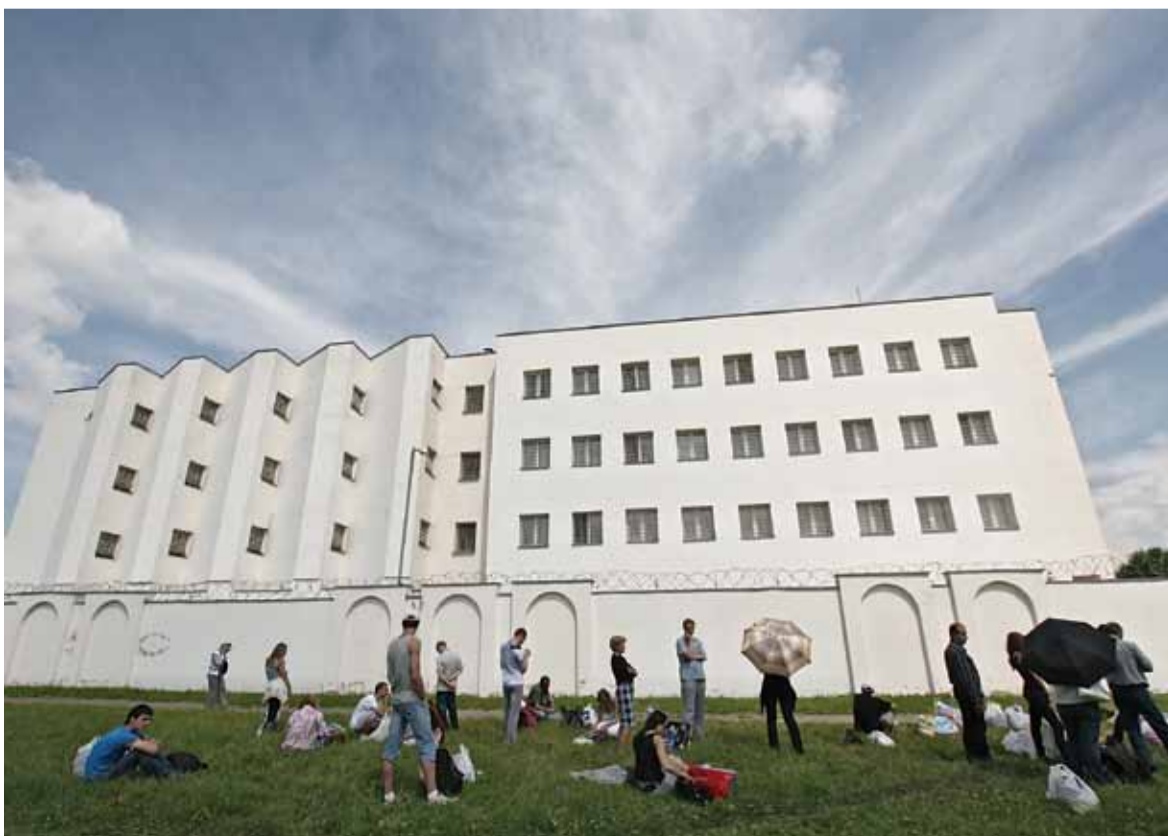
Кожны дзень ля муроў Акрэсціна дзяжурыць некалькі дзясяткаў чалавек.