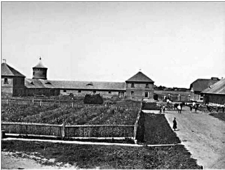
Фальварак Мураванка маёнтка Шчорсы. 1894 г. Намаганнем Яхіма Храптовіча маёнтка Шчорсы ў другой палове XVIII ст. стаў узорнай гаспадаркай. Высокая прадукцыйнасць дасягалася дзякуючы вольнай працы сялянаў.

Калі ж сёння, прыгадваючы пачатак Вялікай рэформы, мы аддаем належнае цару Аляксандру II у яго дзейнасці дзеля прагрэсу Расіі, то мы не павінны забывацца і на імёны айчынных антыпрыгонніцкіх рэфарматараў — Паўла Бжастоўскага, Яхіма Храптовіча, Тадэвуша Касцюшкі.