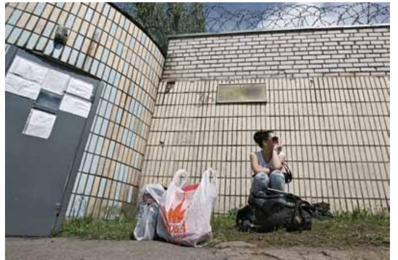
Чакаць сваёй чаргі сямутаму даводзіцца паўдня.