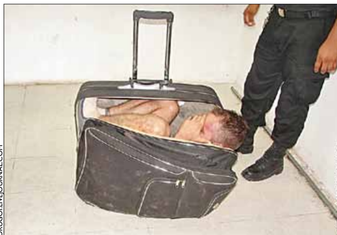
Мексіканскі гангстар Хуан Рамірас Т'ерыне збіраўся ўцячы з турмы, дзе адседжавае 20-гадовы тэрмін, у чамадане. Яго грамадзянская жонка прыйшла на спатканне з вялізнай валізаі вяртаткі. Ахоўнікі звярнулі ўвагу, што пасля візіту чамадан значна пацярпела. Адчынілі — і пабачылі самога Хуана Раміраса.