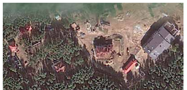
Від са спадарожніка.