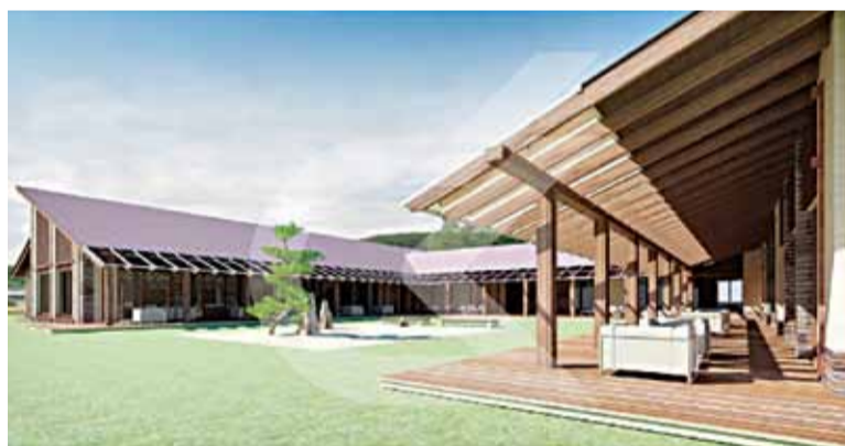
Рэндар жылога комплексу.

праектавальнікам жылога комплексу катэджнага тыпу сумарнай плошчай каля 12 000 м.