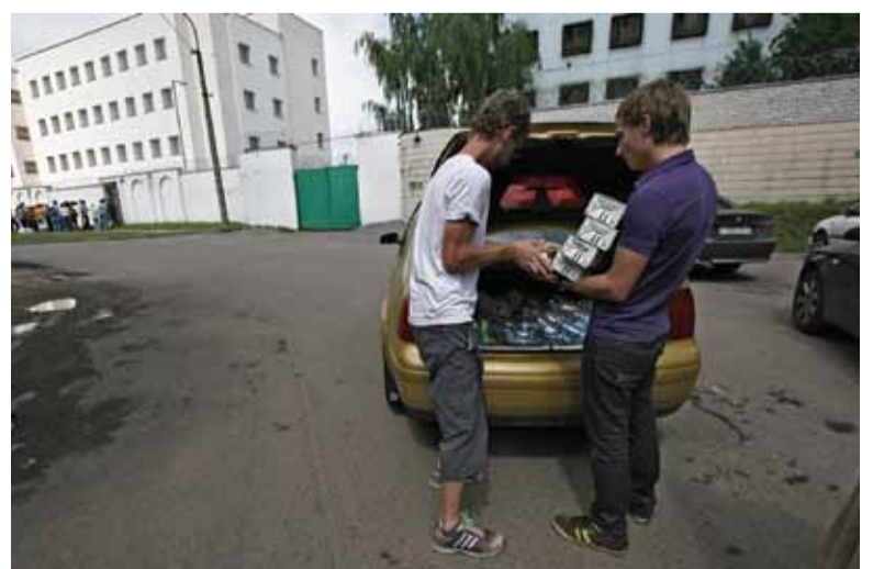
Людзі падвозяць прадукты і напоі для арыштаваных.