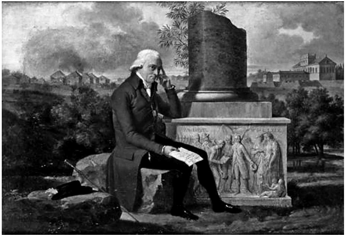
Павал Ксаверы Бжастоўскі. Карціна Ксаўера Фарбэ, 1797 г. Пад уплывам ідэяў Русо ён правёў радыкальныя пераўтварэнні ў сваім маёнтку Мерач (Паўлава). За адно пакаленне яго былі прыгонныя сталі свядомымі грамадзянамі і гаспадарлівымі фермерамі.

На дзяржаўным узроўні рэформы прабіраліся цяжка. Нават Канстытуцыя 3 мая 1791 г. не ліквідавала прыгон. Дзяржава толькі брала пад кантроль выкананне дамоваў паміж землеўласнікамі і іх сялянамі. І толькі ў Паланецкім універсале — заканадаўчым акце начальніка Паўстання 1794 г. Тадэвуша Касцюшкі, выдзеным 7 мая 1794 г., сяляне аб'яўляліся асабіста вольнымі, але зямлі не атрымлівалі.