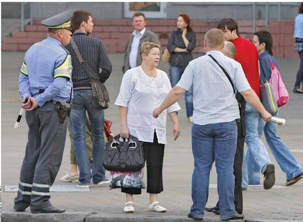
Жыхары Мінска спрачаюцца з асобамі ў цывільным, якія блакуюць цэнтр горада.

Арганізатары просяць не хлопаць, калі ёсць небяспека затрымання. «Каб усё ўдалося, ставім