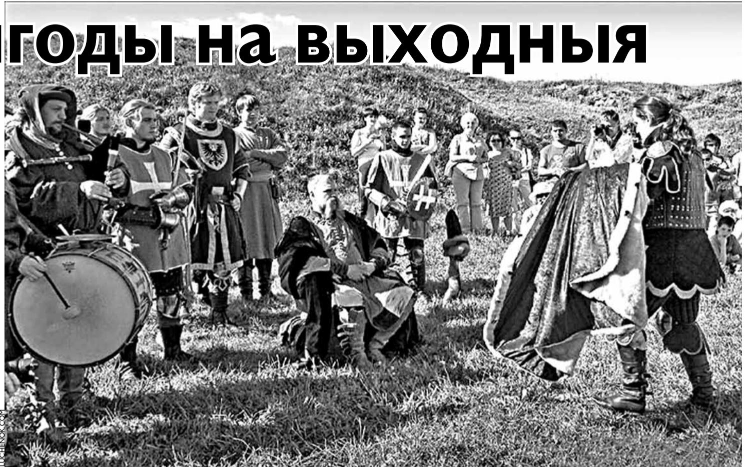
У Навагрудку турыстаў чакае відовішная каранацыя Міндоўга

Шмат хто абыходзіцца і без паслуг спецыялістаў — сеў у машыну ці ў рэйсавы аўтобус і паехаў. Бюджэт такога падарожжа кожны выбірае для сябе, можна ўкласціся ў 30 тысяч з чалавека, а можна гульніць усёй кампаніяй і на мільён. Варта толькі ўлічваць, што дзяржаўныя гасцініцы ў райцэнтрах варта браніраваць загодзі. Звычайна яны просяць за койкамесца 30–35 тысяч.