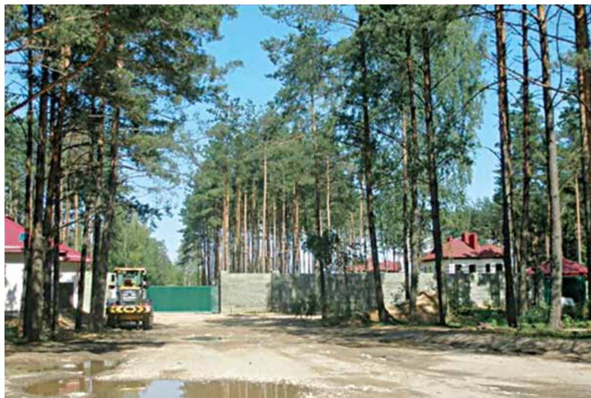
На заднім плане — загадкавыя катэджы.