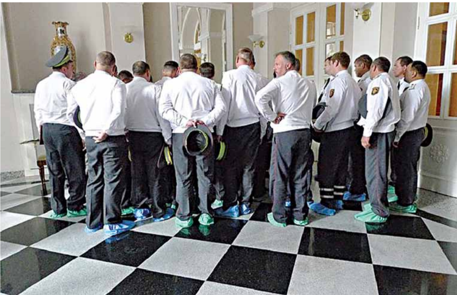
Супрацоўнікі ДАІ на экскурсіі ў палацы Румянцавых-Паскевічаў у Гомелі.