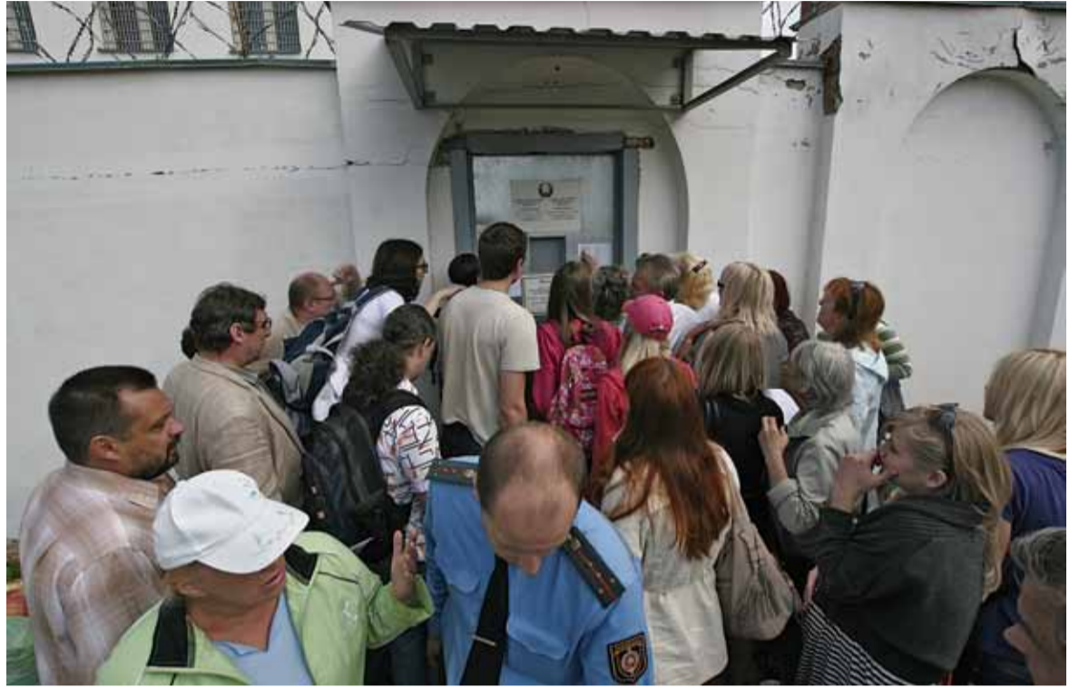
Ранішняя праверка «акрэсцінскіх спісаў».