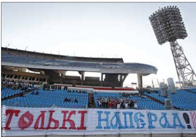
Фанаты вывесілі беларускамоўны банер на трыбунах «Дынама» падчас гульні каманды «Мінск» з АЗАЛ (Баку) у рамках кваліфікацыйнага раўнду Лігі Еўропы. Нашы футбалісты натхніліся і перамаглі 2:0.