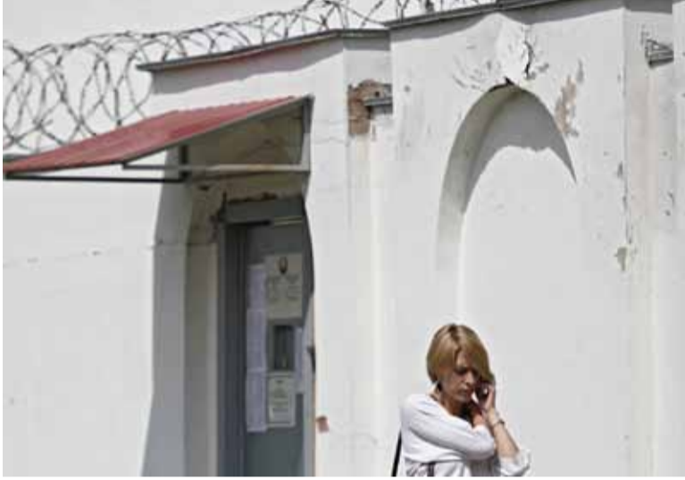
Нехта і дагэтуль не ведае, дзе дакладна знаходзяцца ягоня родныя.