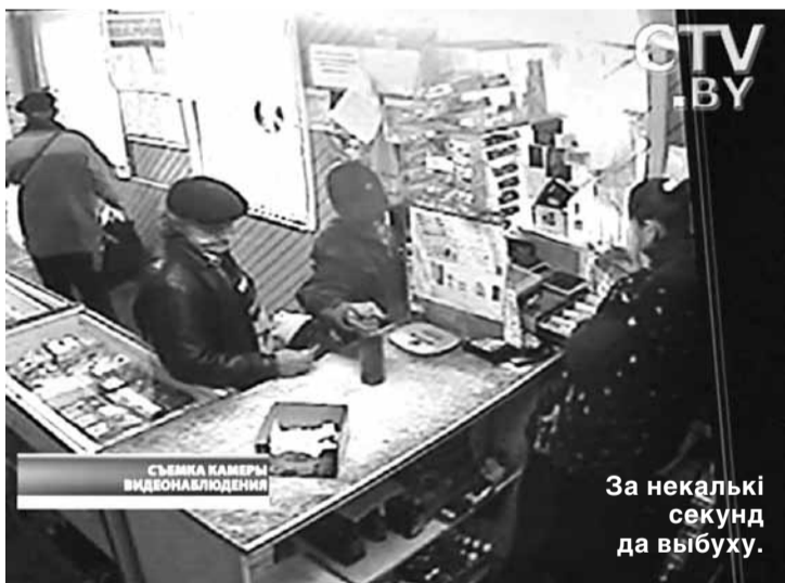
За некалькі секунд да выбуху.

Дагэтуль няясна: ці то быў сапраўдны тэракт, ці то вучэнні, ці то выбух у рамках вучэнняў.