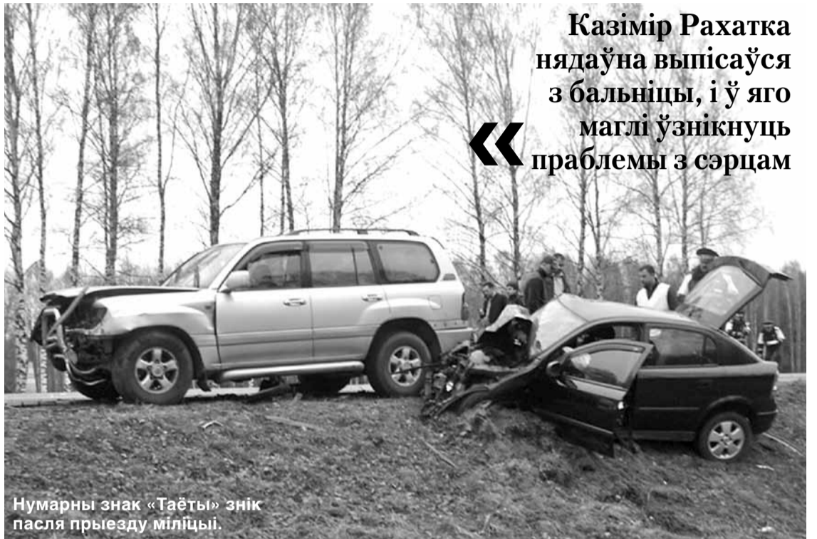
Нумарны знак «Таёты» знік пасля прыезду міліцыі.