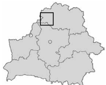
Група Жыхара дзейнічала ў Глыбоцкім і Пастаўскім раёнах.

А хто быў апошнім беларускім партызанам у лясках паміж Глыбокім і Паставамі? Не Жыхар. Вось што раскажаў ляснік-пенсіянер са староў, яшчэ польскіх часоў леснічоўкі на возеры Баравым на Пастаўшчыне: «Дакладна не памятаю, які гэта быў год — мо 1959-ы, а мо і 1957-ы... Я пайшоў у грыбы. Бачу — наперад-зедым ад кастра. Падыйшоў. Сядзяць трое у плашчах, у двух карабіны, у трэцяга аўтамат. Сушаць вопратку. Мяне не чапалі, адпусцілі...»