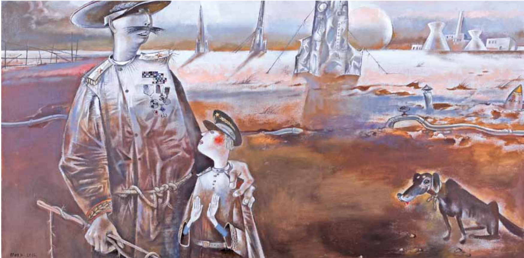
Алесь Марачкін стварыў новую карціну «Два генералы, пуга і сабака». Пакуль яе бачылі толькі сябры мастака на прэзентацыі «для сваіх».