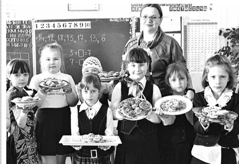
У Жодзіне працуе адзіная ў Беларусі жаночая гімназія.