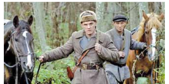
Партызаны прыходзяць да Сусчэні, каб забіць яго за «зраду».

Гэта другая гультывая стужка дакументаліста Лазніцы. Першым досведам быў фільм пра жыццё расійскай глыбінкі «Шчасце маё», які два гады таму такса-