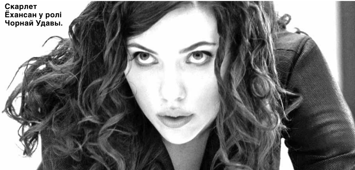
Скарлет Ёхансан у ролі Чорнай Удавы.